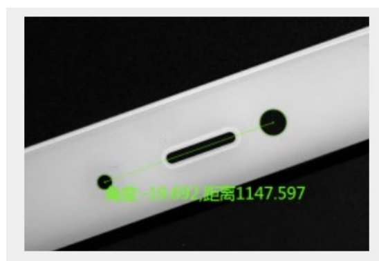
图 2 产品尺寸检测示意图

通过视觉识别，要求测量出产品上指定位置的尺寸距离，并判断是否符合尺寸范围要求。具体尺寸位置和合格范围会在比赛前公布，测量尺寸的产品无需检测缺陷和编号。标注尺寸信息及是否合格后的照片保存到本地待查。