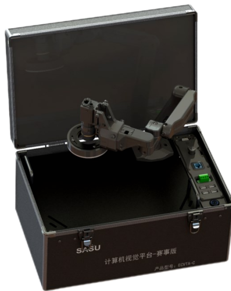
图4 计算机视觉平台-赛事版实验箱

平台包含赛项指定的软件平台和设备，符合参赛要求，已经做好集成安装和配置，配套显示器、USB网卡和键鼠外设，包含教学课程。